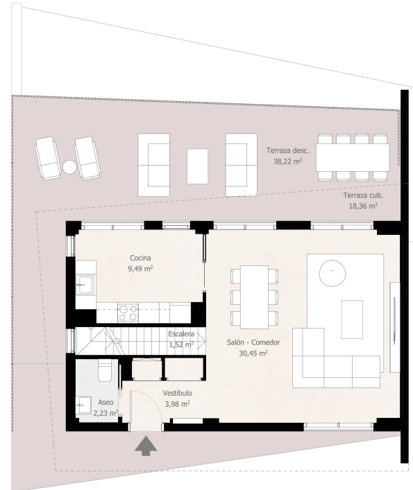
Planta acceso. Opción cocina cerrada